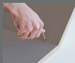
4. Spojit a hotovo!